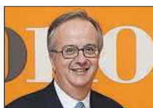
Simón Pedro Barceló Grupo Barceló