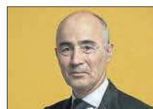
Rafael del Pino Ferrovial