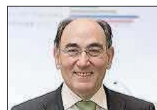
Ignacio Sánchez Galán Iberdrola