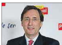
Tomás Pascual Calidad Pascual