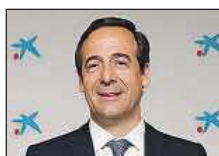
Gonzalo Gortázar CaixaBank