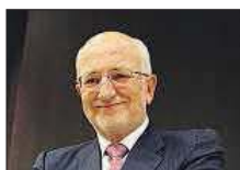
Juan Roig Mercadona