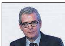
Pablo Isla Inditex