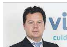
Jorge Gallardo Piqué Hospitales Vithas