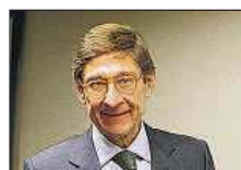
José Ignacio Goirigolzarri Bankia