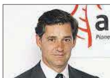
José Manuel Entrecanales Acciona