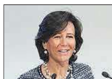
Ana Botín Banco Santander